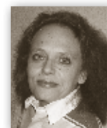
Daniela de Cillia Redaktion/Fotografie